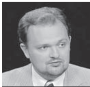
ROSS DOUTHAT

In 2004, the Democrats were furious at what they considered the fraud to end all frauds: the selling of George W. Bush as a decisive military leader and all-American tough guy. So they nominated John Kerry for the presidency, hoping that having a real combat veteran as their standard-bearer – a bemedaled war hero, no less, who began his convention speech by announcing that he was "reporting for duty" – would finally expose Bush as the tinhorn chicken hawk that liberals believed him to be.